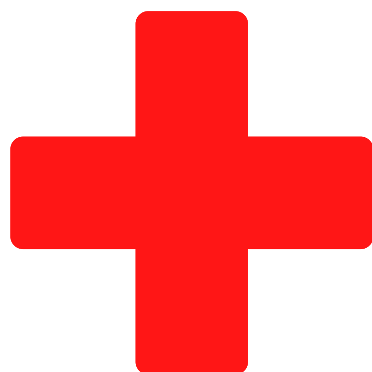
Znak Crvenog križa